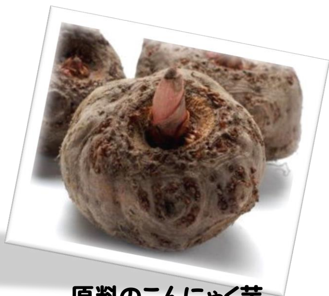
原料のこんにゃく芋